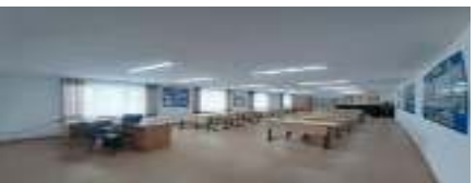
Өзін-өзі тану сыныбы