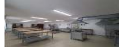
Лаборатория организации питания