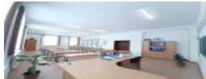
Кабинет русского языка и литературы