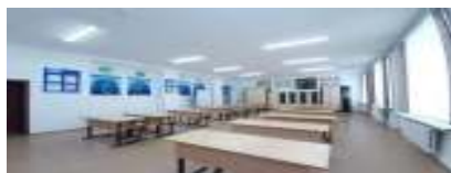
Қазақ тілі және қазақ әдебиеті сыныбы