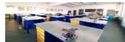
Слесарлық іс шеберханасы