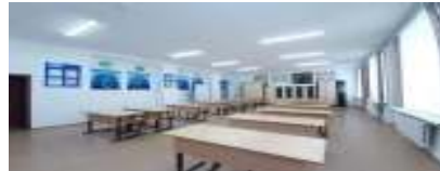
Кабинет казахского языка и литературы