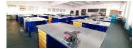
Мастерская слесарное дело