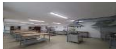
Тамақтануды ұйымдастыру зертханасы