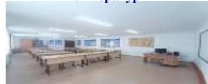
Кабинет организации питания