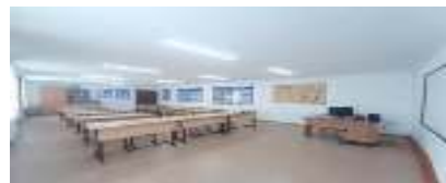
Кабинет организации питания