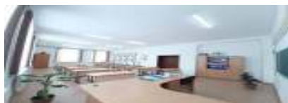
Орыс тілі және орыс әдебиеті сыныбы